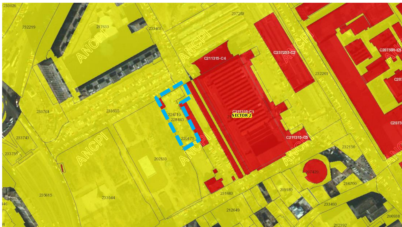
Extras din ANCPi – Imobile eTerra

De asemenea, a fost realizată o documentație de urbanism PUZ Strada Câmpul Moșilor nr 5, Sector 2, București , aprobată prin HCGMB nr 256/ 14.12.2015 , care a produs efecte în teritoriu, urmând a fi implementată în cadrul reglementărilor din cadrul PUZ sector 2, în urma dezbaterii în cadrul comisiilor de specialitate și a comisiilor tehnice din cadrul Primăriei Municipiului București.